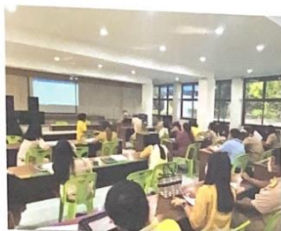
รูป. รูปภาพประกอบกิจกรรม (ตามระบบวงจรคุณภาพ PDCA)